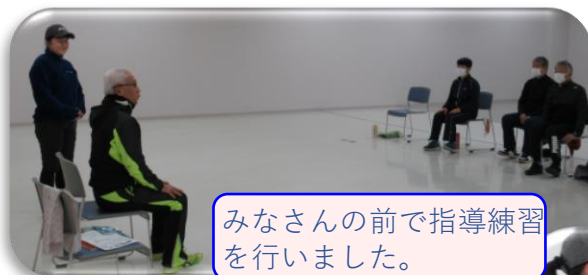
みなさんの前で指導練習を行いました。

椅子に座ってつま先、かかと上げ、立ち上がり動作や椅子を横につかまりながら太もも上げ、タオルを使い上半身を伸ばして行う一連の運動は、無理なく基本的な筋力トレーニングができる講師が勧める貯筋運動です。